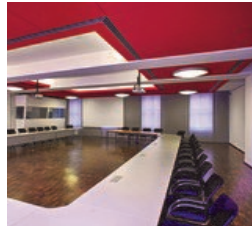
Das Haus „Berlin“ der Bundesakademie und einer der Seminarräume im Gebäude, die mit moderner Konferenz- und Veranstaltungstechnik ausgestattet sind.